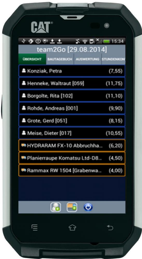
team2Go auf einem robusten CAT B15