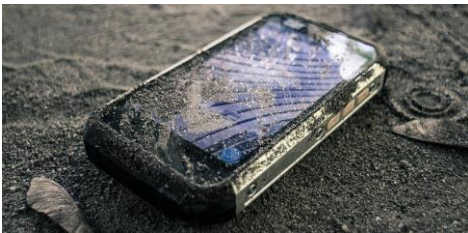
Das CAT B15 im Einsatz auf der Baustelle (die APP läuft auf jedem Android-Gerät)